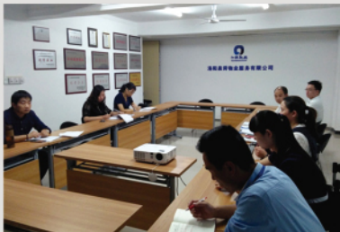
第一阶段：创优总动员

2017年为洛阳泉舜物业的“服务提升年”，泉舜物业人每时每刻都在想着如何提升服务品质。在公司各级领导的支持和关怀下，都在努力向着高服务品质方向发展。自参评“省级物业服务公共物业示范项目”以来，公司领导挂帅，与物业管理处、各职能部门组成创优工作小组，加强对“创优”工作的协调与支持力度，确保“创优”工作必要的人力、物力保障。